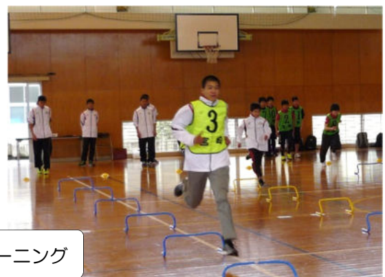
中2 SAQ トレーニング