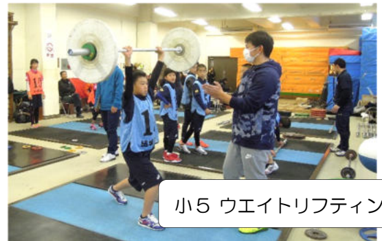
小5 ウエイトリフティング