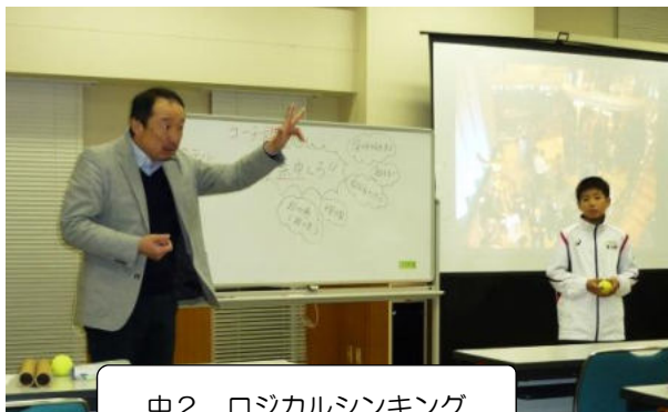
中2 ロジカルシンキング