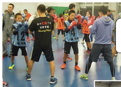
中1・小5 ボクシング