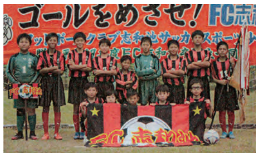
FC志和池サッカースポーツ少年団(都城市)