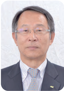
公益財団法人宮崎県スポーツ協会