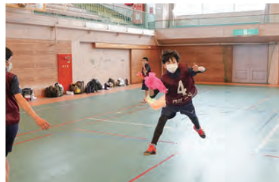
コーディネーショントレーニング