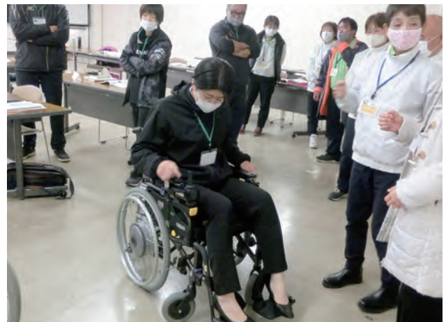
〈チャレンジドスポーツ〉