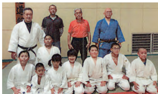
清武柔道スポーツ少年団(宮崎市)