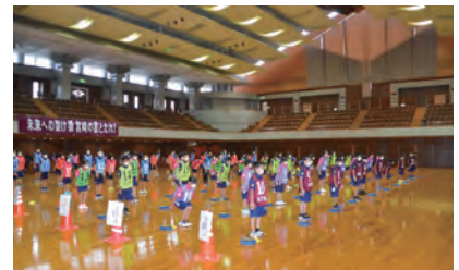
オリエンテーション