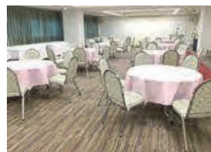
▲エメラルドホール