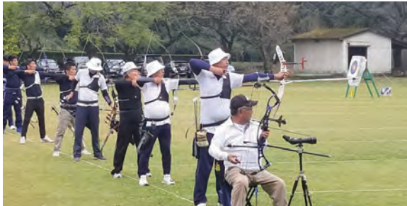
～ アーチェリー競技 ～