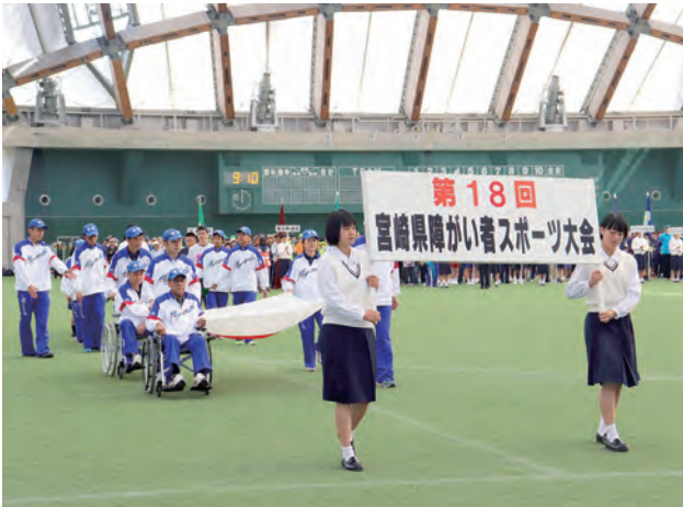
〈令和元年度県大会開会式〉