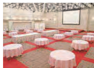
▲ダイヤモンドホール

大人 5,000 円 高校生 4,000 円 中学生 3,500 円 小学生 3,000 円