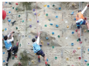
スポーツクライミング