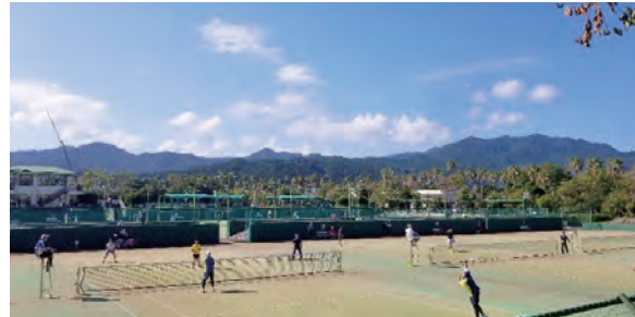
～ ソフトテニス競技 ～