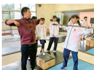
ウエイトリフティング