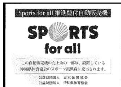
※自動販売機ステッカー

本県体育スポーツの普及と振興、競技力向上対策事業の充実を図るため、日本スポーツ協会オフィシャルパートナーである大塚製薬株式会社と協力し、『Sports for all 推進費付き自動販売機設置事業』を実施してきましたが、令和元年10月1日より日本スポーツ協会が契約から外れ、代わりに本県スポーツ協会が契約に入ることになりました。