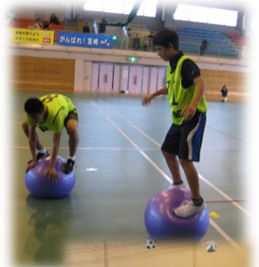
バランスボールの上に乗ってみよう!