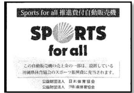
※自動販売機ステッカー

公益財団法人宮崎県体育協会では、本県体育スポーツの普及と振興、競技力向上対策事業の充実を図るため、日本体育協会オフィシャルパートナーである大塚製薬株式会社と協力し、『Sports for all 推進費付き自動販売機設置事業』を実施しています。